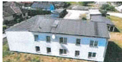
B1: Mehrfamilienwohnhaus - Ansicht von Süden