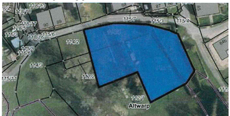
Geltungsbereich Bebauungsplan Nr. 7/2022 „Wohnen Hafengasse“