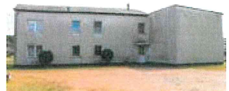
B1: Mehrfamilienwohnhaus - Ansicht von Norden